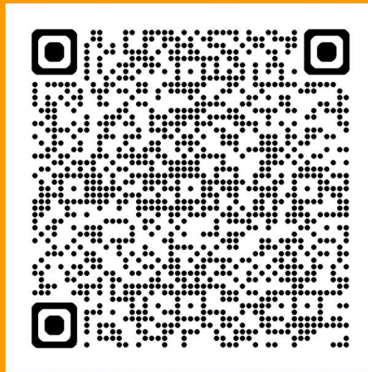
ENLACE A NOTICIA SERMI