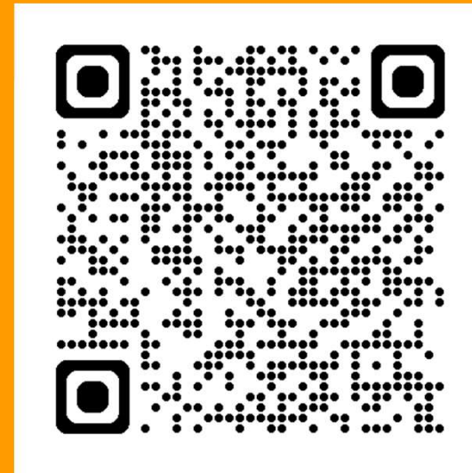
SOLICITUD DE PRESUPUESTO

Applus+: Inspección, Certificación y Ensayos en todo el mundo